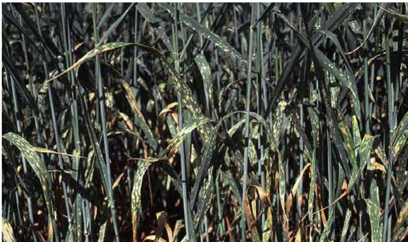
Redwin 冬小麦; 照片来自Fort Smith Montana附近的扬花期后的试验小麦。试验田品种统一, 全田小麦叶片都出现这种症状。土壤测试表明, 试验地土壤氯含量低下。