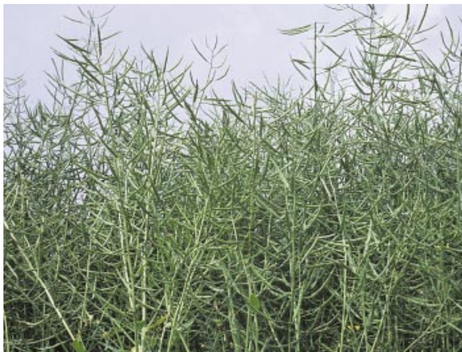
Ryc. 9. Plantacja rzepaku w zachodniej części kraju (Dolny Śląsk)

ważnym czynnikiem agrotechnicznym kształtującym wielkość i jakość plonu nasion jest prawidłowe nawożenie potasem.