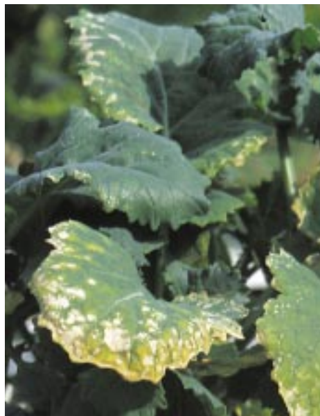
Ryc. 3. Objawy niedoboru potasu na młodych roślinach rzepaku