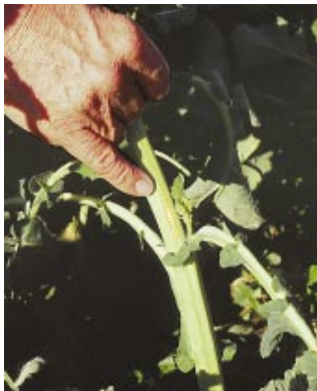
Ryc. 2. Uszkodzenia roślin rzepaku przez przymrozek majowy

Na roślinach rzepaku uprawianego na glebach ubogich w potas, występują objawy niedoboru widoczne w pierwszej fazie w formie niebieskozielonego zabarwienia liści i żółtych plam (ryc.3), a następnie liście brunatnieją i obumierają (ryc. 4).