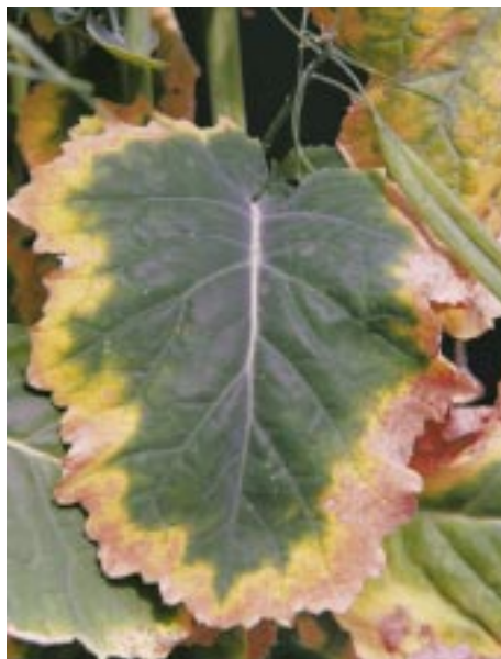
Ryc. 4. Silne objawy niedoboru potasu na roślinach rzepaku