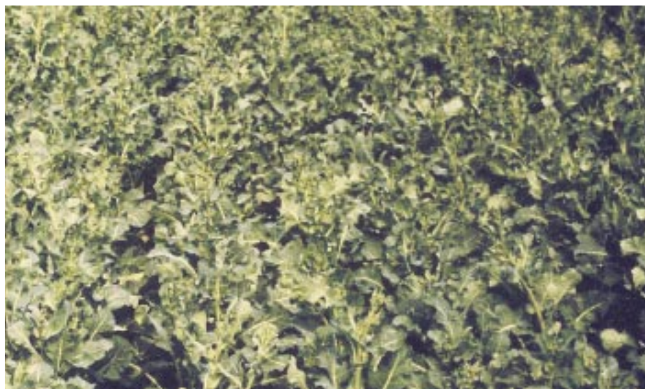
Ryc. 8. Rzepak w fazie zwartego zielonego pąka