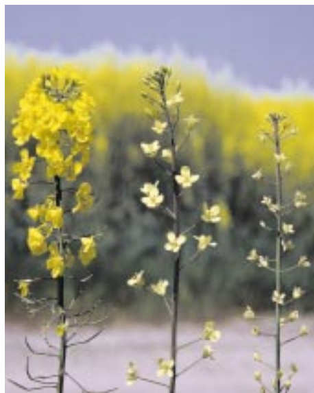
Ryc. 7. Objawy niedoboru siarki na roślinach rzepaku