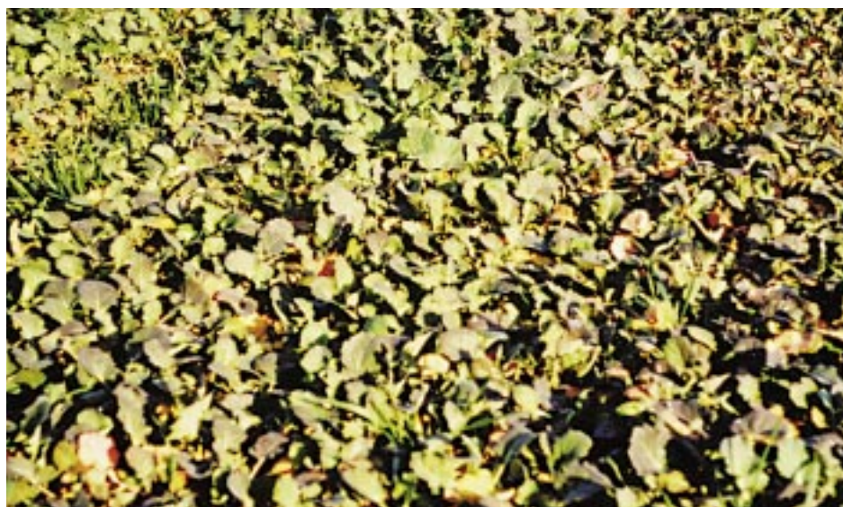
Ryc. 5. Niedobór magnezu na roślinach rzepaku – jesień

W nawożeniu rzepaku, oprócz azotu, fosforu i potasu, ważnymi składnikami są magnez i siarka. W warunkach polskiego klimatu, niedobory magnezu często występują już w okresie jesiennych chłódów (druga połowa października), ponieważ przy niedoborowej zawartości magnezu w glebie, w niskiej temperaturze rzepak nie może pobrać wystarczającą ilość tego składnika (ryc. 5).