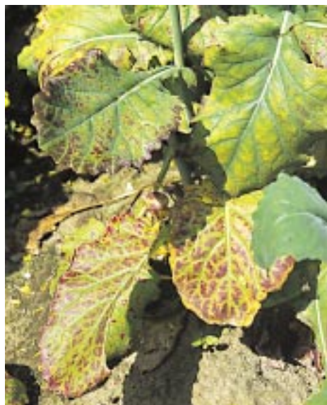
Ryc. 6. Niedobór magnezu na roślinach rzepaku – wiosna

Przy niedostatecznej zasobności gleb w magnez, jego niedobory występują też na starszych roślinach w okresie wiosennym (ryc. 6). W warunkach niedoboru siarki, najpierw pojawiają się na liściach żółte plamy, a następnie w czasie kwitnienia występuje białawe zabarwienie słabo rozwiniętych kwiatów (ryc. 7).